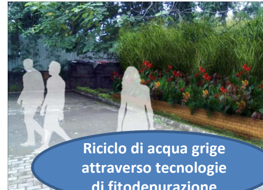
Riciclo di acqua grige attraverso tecnologie di fitodepurazione