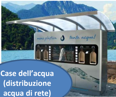
Case dell'acqua (distribuzione acqua di rete)