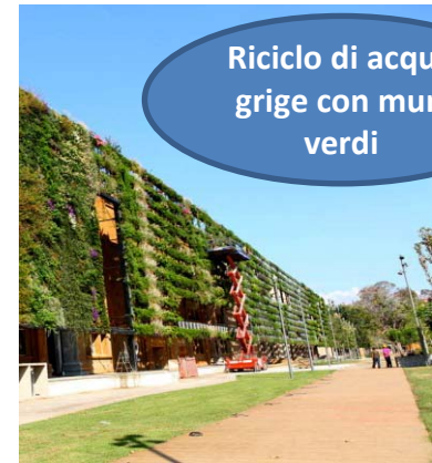
Riciclo di acque grige con muri verdi