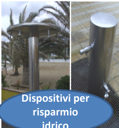
Dispositivi per risparmio idrico