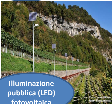
Illuminazione pubblica (LED) fotovoltaica