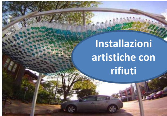
Installazioni artistiche con rifiuti