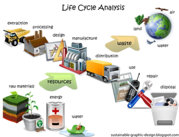
Figura 1 – Le fasi del Ciclo di Vita

La norma ISO 14040:2006 descrive i principi e la struttura di una analisi del ciclo di vita (LCA) definendo: gli obiettivi e l'ambito di applicazione, la fase di analisi dell'inventario (LCI), la fase di